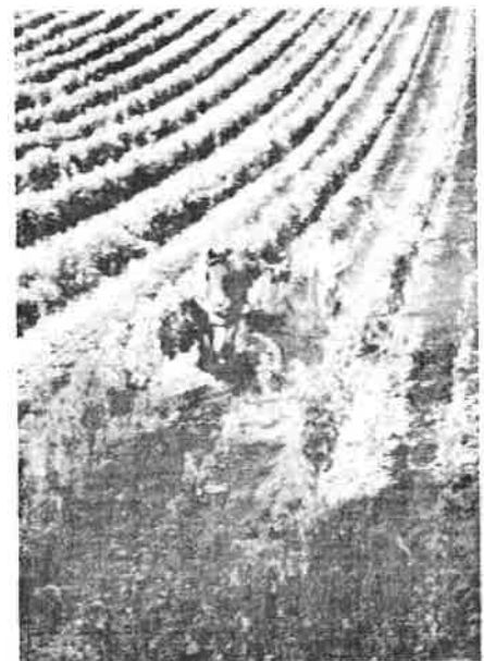
Un partenariat officiel dans les vignes.

Depuis mai dernier, l'atelier de fabrication du MAMATA compte un nouveau soudeur. Bienvenue dans l'équipe Jérôme !