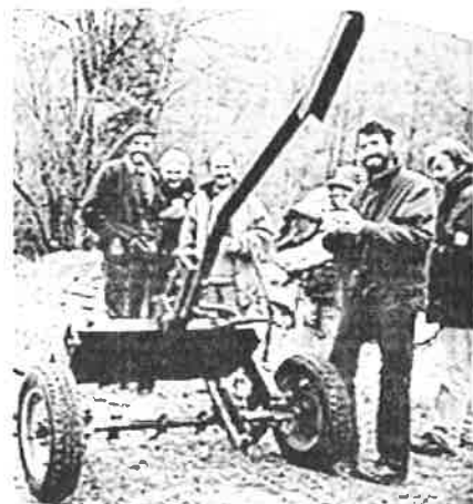
AG : des adhérents autour du Polynoi.

L'AG 2003 avait demandé un effort sur la communication. Ce travail a été fait et les résultats ont été décisifs. Nos actions sont médiatisées, renforçant notre notoriété, des partenaires nouveaux sont attirés, le réseau des adhérents s'étoffe et nous constatons même que notre matériel commence à être copié!